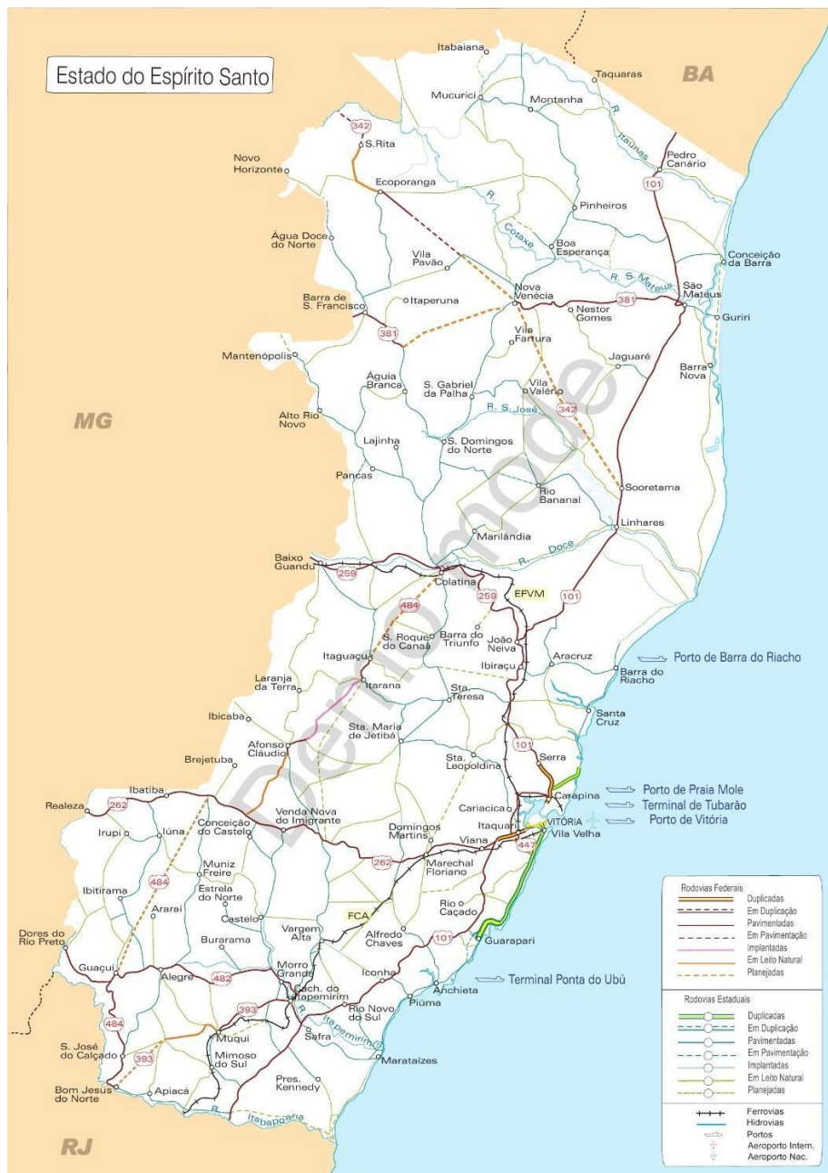
Figura 1 – Mapa Regional do Espírito Santo