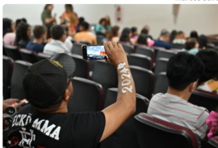
Homenagem aos estudantes que foram aprovados no Ifes. 🔍

era a maior covardia, porque nos bairros de classe média e classe média alta tinham aprovados nas seleções mais difíceis do Brasil e do Espírito Santo. Mas às áreas periféricas, às áreas de maior vulnerabilidade social, no local em que residem as famílias que têm o menor poder aquisitivo, essa realidade nunca havia chegado", disse o prefeito.