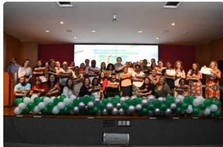
Homenagem aos estudantes que foram aprovados no Ifes. 🔍

era a maior covardia, porque nos bairros de classe média e classe média alta tinham aprovados nas seleções mais difíceis do Brasil e do Espírito Santo. Mas às áreas periféricas, às áreas de maior vulnerabilidade social, no local em que residem as famílias que têm o menor poder aquisitivo, essa realidade nunca havia chegado", disse o prefeito.