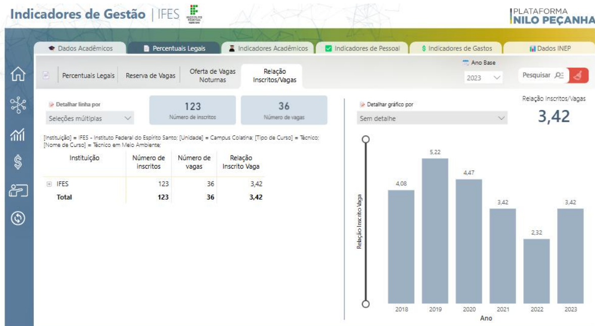
Figura 1: Relação Inscritos / Vagas curso Técnico em Meio Ambiente do Ifes campus Colatina