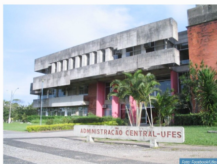
Prédio da administração central da Ufes

MPF vai reunir representantes da universidade e do Ifes na segunda-feira (10) para discutir impactos do congelamento de verbas