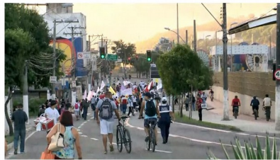
VITÓRIA, 7h30: Manifestantes em passeata no Centro de Vitória

Sindicalistas que participavam da manifestação foram presos, nesta manhã (14). Segundo a polícia, eles estavam esvaziando pneus e arremessando pedras contra ônibus na Serra. Ainda não há mais detalhes sobre as prisões.