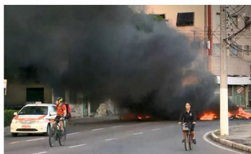
VITÓRIA, 7h30: Manifestantes atearam fogo em pneus no Centro de Vitória

Teve bloqueio também na Avenida Dante Michelini, na altura da Praia de Camburi, em Vitória, onde um grupo de manifestantes fechou duas pistas no sentido Centro. A Polícia Militar acompanhou o ato e informou que não houve confronto entre policiais e manifestantes.