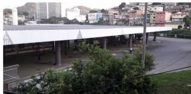
Cariacica, 6h: Terminal de Campo Grande, em Cariacica, com poucos ônibus na manhã desta sexta-feira (14)

Nos terminais de Campo Grande, em Cariacica, e São Torquato, em Vila Velha, ônibus circulam em número reduzido, segundo relatos de passageiros.