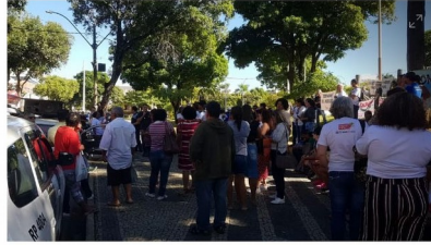
COLATINA, 10h: Manifestantes em Colatina, no Espírito Santo, nesta sexta-feira (14)

Já em Colatina, na região Noroeste, manifestantes ocuparam uma das praças da cidade e seguiram em passeata pelas ruas. A manifestação começou por volta das 10h.