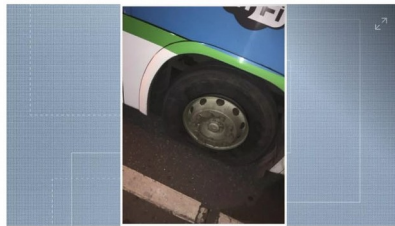
Ônibus tiveram pneus esvaziados em Carapina, na Serra

"O sistema rodou com 74% da frota, até às 10 horas. A operação dos terminais foi considerada normal, apesar dos atrasos em função das retenções registradas na Região da Grande Vitória", disse em nota.