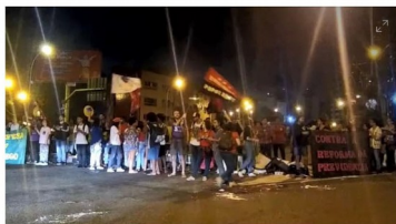
VILA VELHA, ES: Manifestantes fecharam a Terceira Ponte logo nas primeiras horas da manhã

Na Terceira Ponte, em Vila Velha, manifestantes bloquearam o acesso à Vitória. Eles atearam fogo em pneus para impedir a passagem de veículos, que foram desviados por agentes da Guarda Municipal para a Segunda Ponte. Depois, o grupo liberou uma das vias.