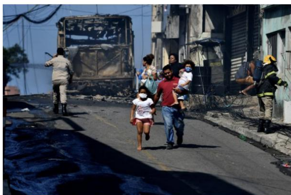
Vitória convive com o clima de medo em muitos bairros após ataques a ônibus nesta terça-feira (11).