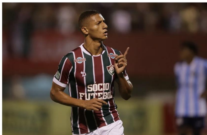
Richarlison comemora gol pelo Fluminense, em 2017

Em um vídeo que circula pelas redes, o craque conta que 10% de seu salário vai para o Instituto Padre Roberto Lettieri, organização sediada em Barretos, São Paulo, que abriga crianças em tratamento de câncer. Em janeiro de 2021, ele doou dez cilindros de oxigênio para unidades de saúde em Manaus, onde pacientes de Covid-19 estavam morrendo devido à falta do elemento. Além disso, Richarlison incentivou a vacinação e doou suas chuteiras usadas na Copa América de 2021 para um leilão que beneficiou um programa da USP voltado para pesquisas e ações de combate à pandemia.