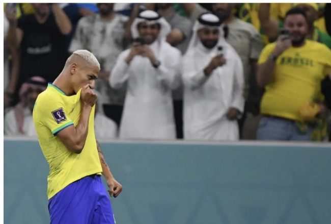
Richarlison comemora gol na estreia da Copa do Catar